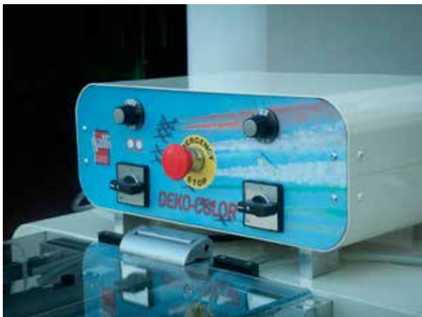
Ceratori - Wax unit