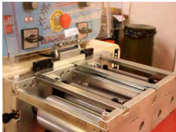
Guide - Rulers