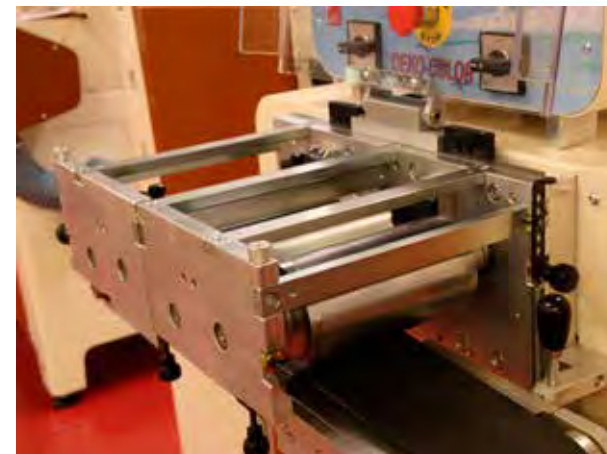
Unità spazzolatura - Polishing unit